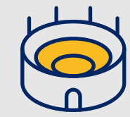
大型活动和娱乐演出